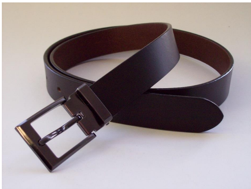
Fot. 1. Wzór paska skózanego do spodni lub spódnicy

Pasek składa się z: części zasadniczej skórzanej, klamry metalowej, przesuwki skórzanej.